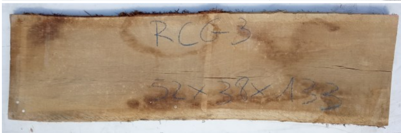
Tavola in legno massello di Rovere di Slavonia grezzo non refilato essiccato. Unico pezzo disponibile. All'interno immagini più dettagliate.