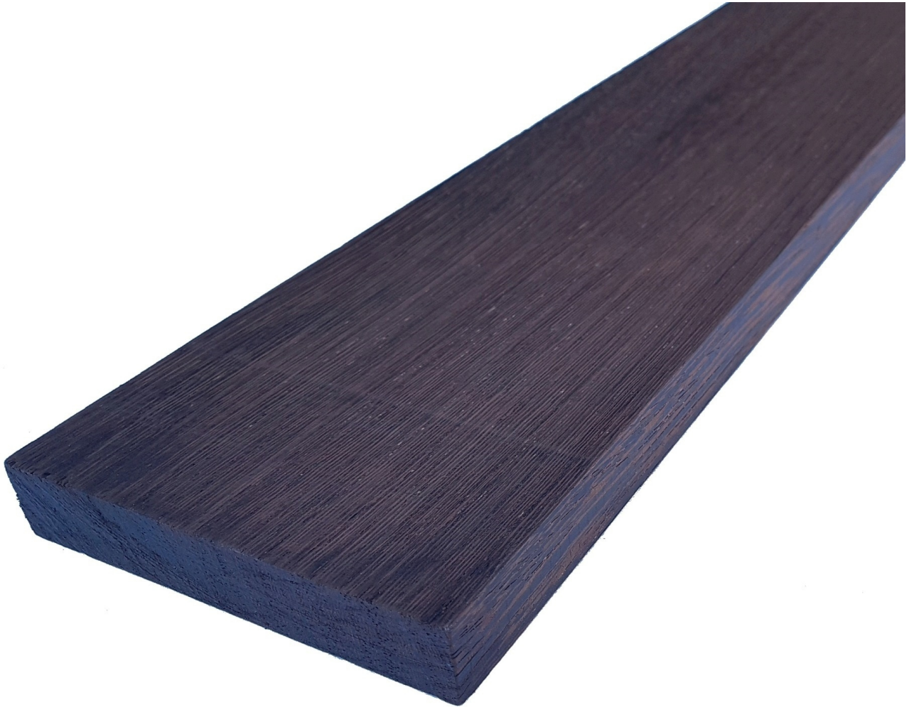
Tavola in legno Massello di Wengè grezzo - Bricolegnostore

Tavola Legno di Wengè Refilato Grezzo mm 28 x 200 x 2000 SECONDA SCELTA