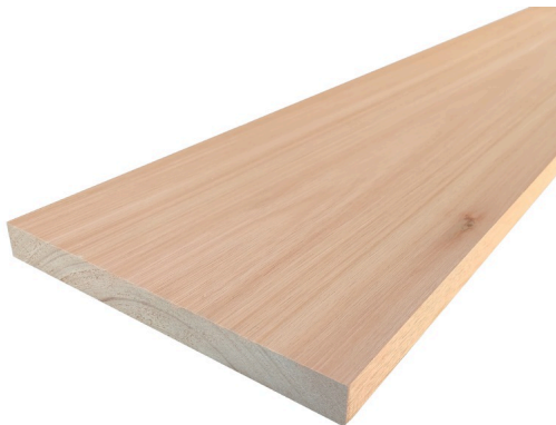
Tavola legno di Red Grandis Refilato Piallato mm 21 x 170 x 1400