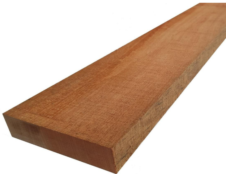
Tavola Legno di Okoumè Refilato Grezzo mm 65 x 100 x 1400