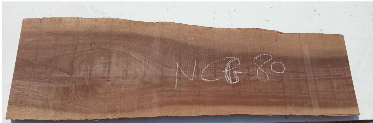
Tavola Legno di Noce Canaletto Non Refilato Grezzo mm 30 x 280 x 1080