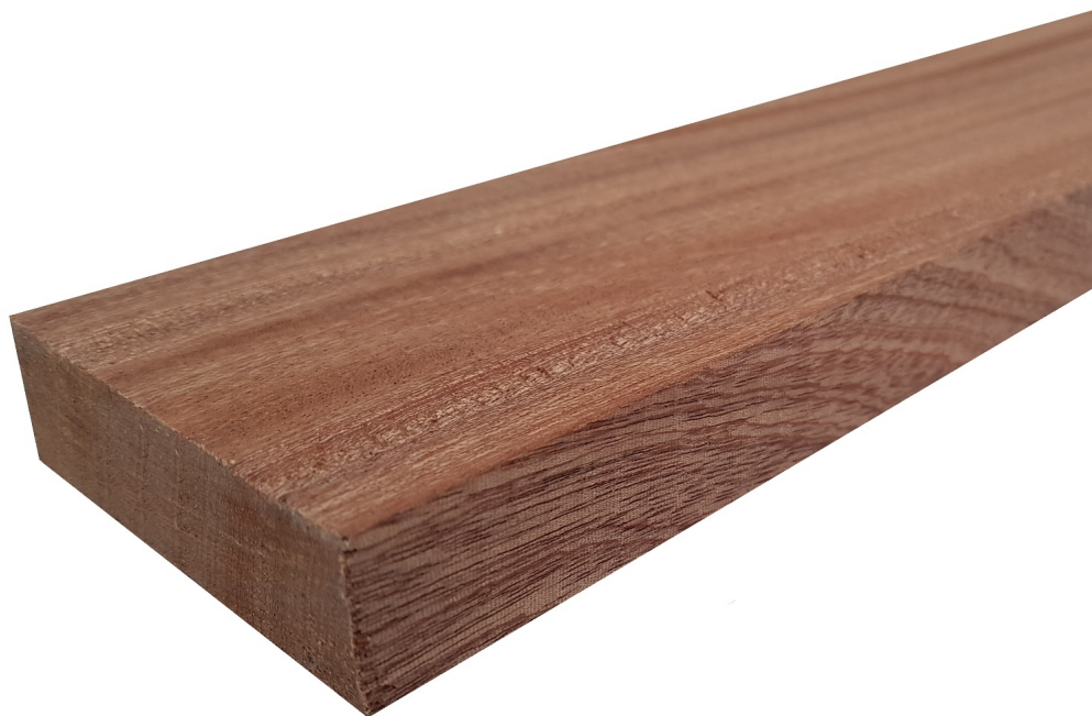
Tavola legno di Mogano Sapelli Refilato Piallato mm 32 x 360 x 2250