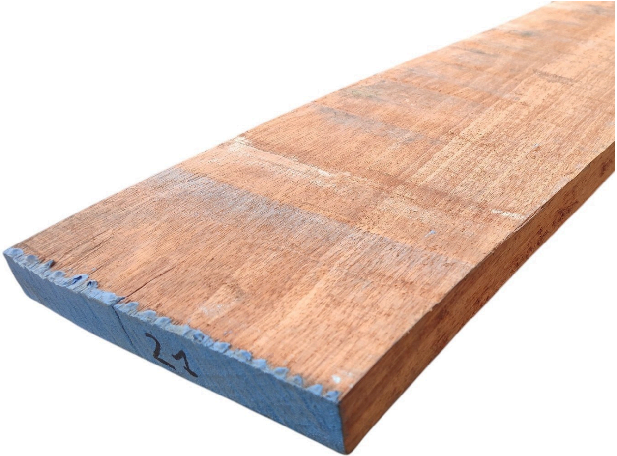
Tavola Legno di Doussié Refilato Grezzo

Tavola Legno di Doussié Refilato Grezzo mm 33 x 440 x 3700