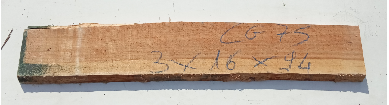
Tavola Legno di Ciliegio Americano Non Refilato Grezzo mm 30 x 160 x 940