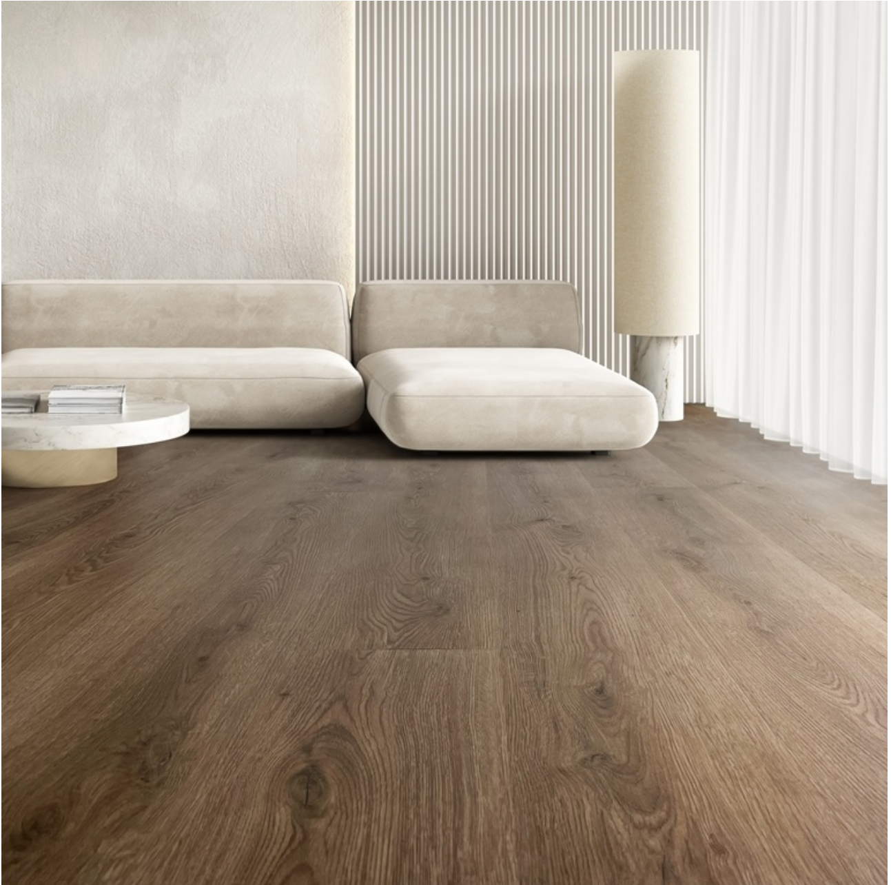
Pavimento Parquet in ESPC