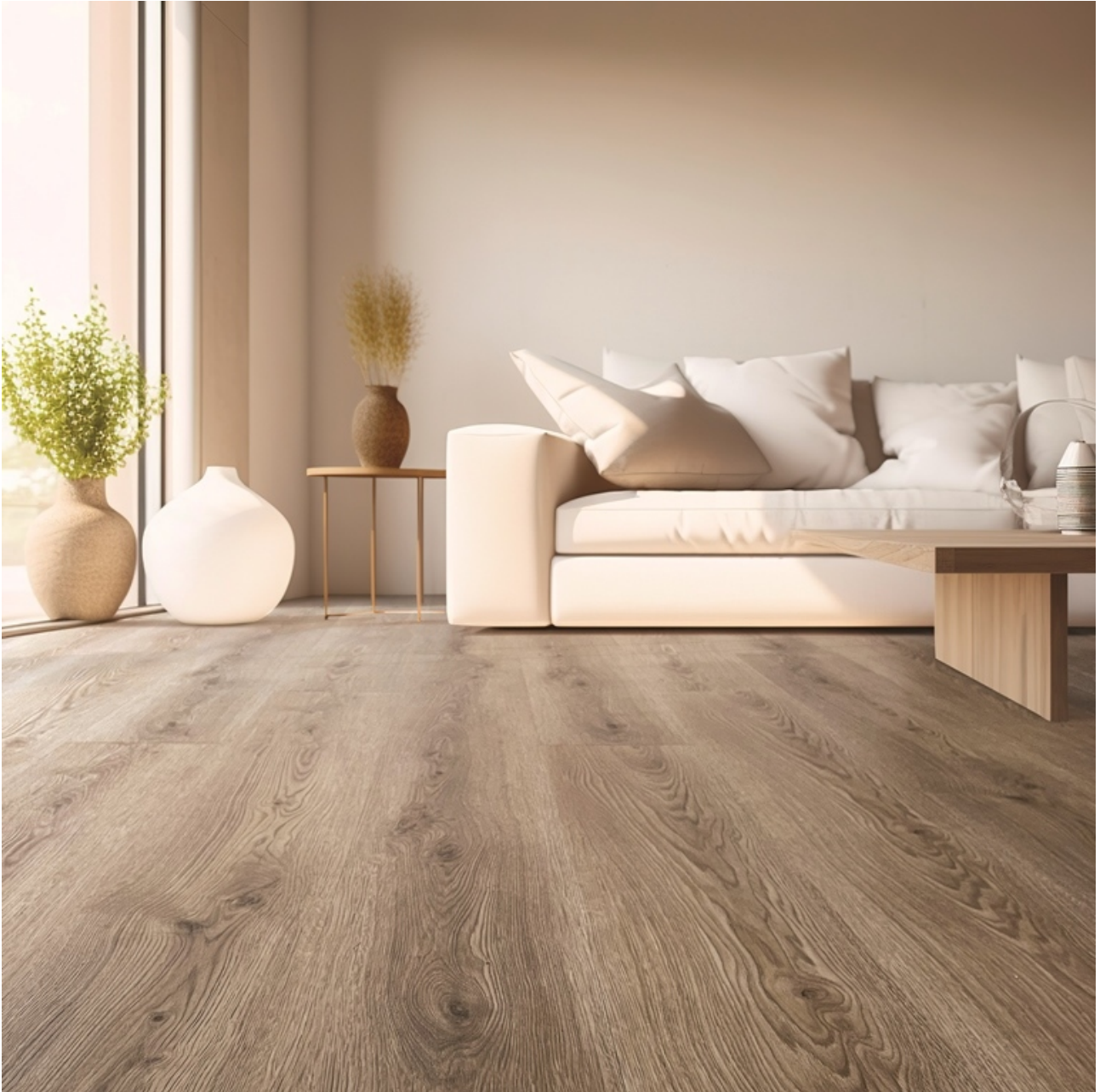
Pavimento Parquet in ESPC