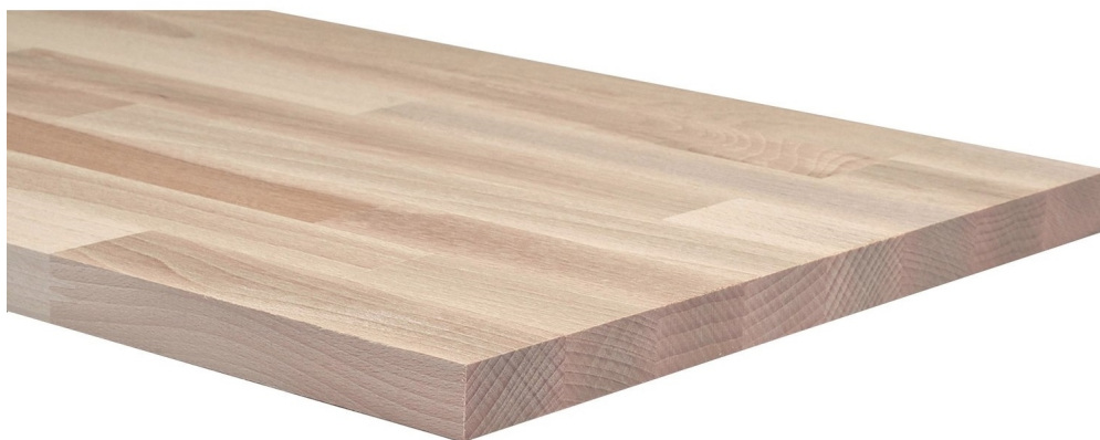
Pannello in legno Lamellare di Faggio