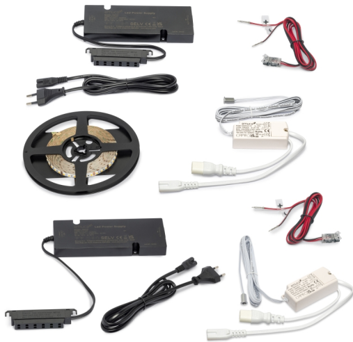
Emuca Kit di strisce LED Lynx Premium 9,6W/m IP20 (12V DC), DOOR, Tecnoplastica,