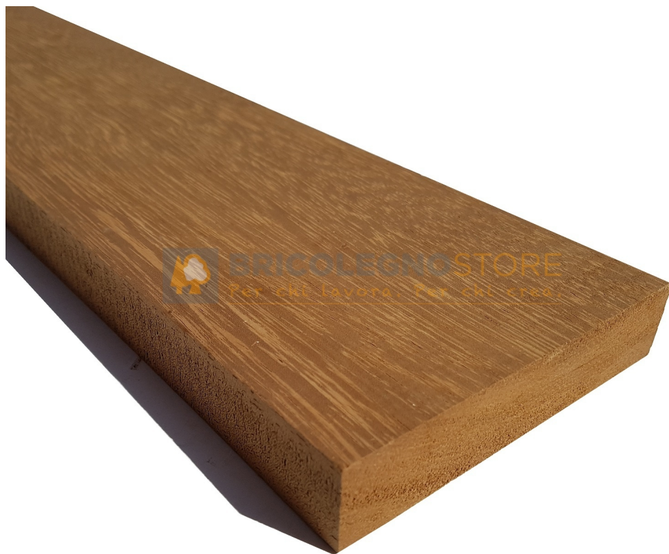
Tavola Legno di Iroko Refilato Grezzo mm 42 x 320 x 1200